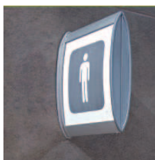
Plaques Curve complètes anodisées assemblées par une platine murale alu :