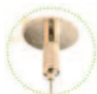
Support Up and Down : Pièce de fixation plafond